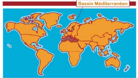
Des plantes du monde entier