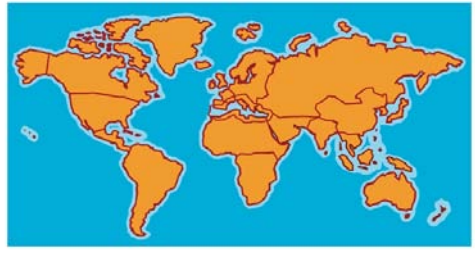
Des plantes du monde entier