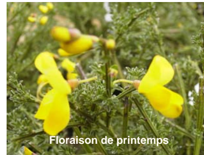
Floraison de printemps

Arbuste rampant, de 20 cm de haut pour 1,50 m de large. Feuillage gris vert, caduc. Fleurs jaunes en mai et juin.