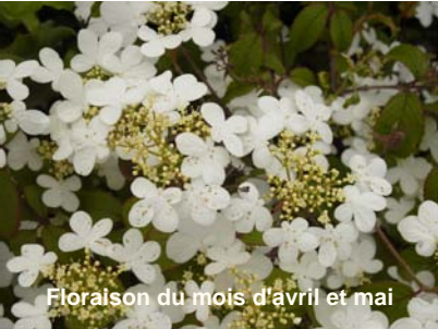
Floraison du mois d'avril et mai

Variété supérieure à Watanabe, quant à sa floraison. Fleurs blanches en ombelles plates du printemps jusqu'à l'automne. Supporte le plein soleil. Hauteur d'environ 2 m, pour une largeur de 1,5 m. Feuillage caduc vert foncé devenant pourpre à l'automne.