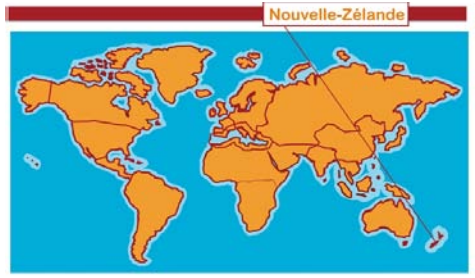
Des plantes du monde entier