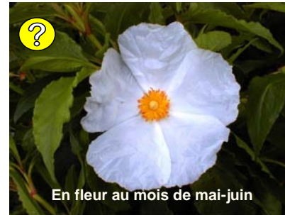
En fleur au mois de mai-juin

Beau feuillage persistant, vert brillant et lancéolé de 10 cm de longueur. Grande fleur blanche en mai-juin. Variété issue d'une hybridation naturelle, à végétation très vigoureuse et érigée, d'une hauteur adulte de 1 à 1,5 m.