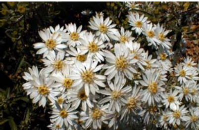
En fleurs dès le milieu du mois d'avril

Arbuste à beau feuillage grisâtre persistant. Végétation rapide et compacte, d'environ 1,50 m de haut. Fleurs en profusion en mai, blanches.