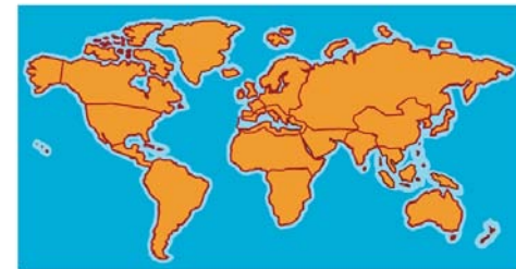
Des plantes du monde entier