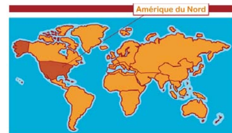
Amérique du Nord