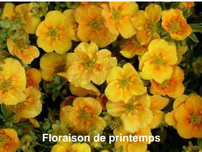
Floraison de printemps

Cultivar à port bas et compact, de moins de 50 cm de hauteur pour 70 cm de largeur, formant un coussin. Feuillage caduc découpé, vert franc, jaunissant en automne. Fleurs orange vif au printemps, pâlissant en été, puis refloraison possible en automne.